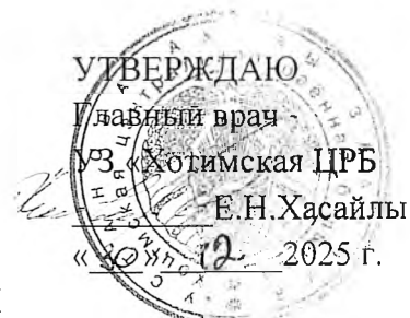
ГРАФИК РАБОТЫ ПЕРЕДВИЖНОГО ФЕЛЬДШЕРСКО-АКУШЕРСКОГО ПУНКТА ЯНВАРЬ 2026 г.